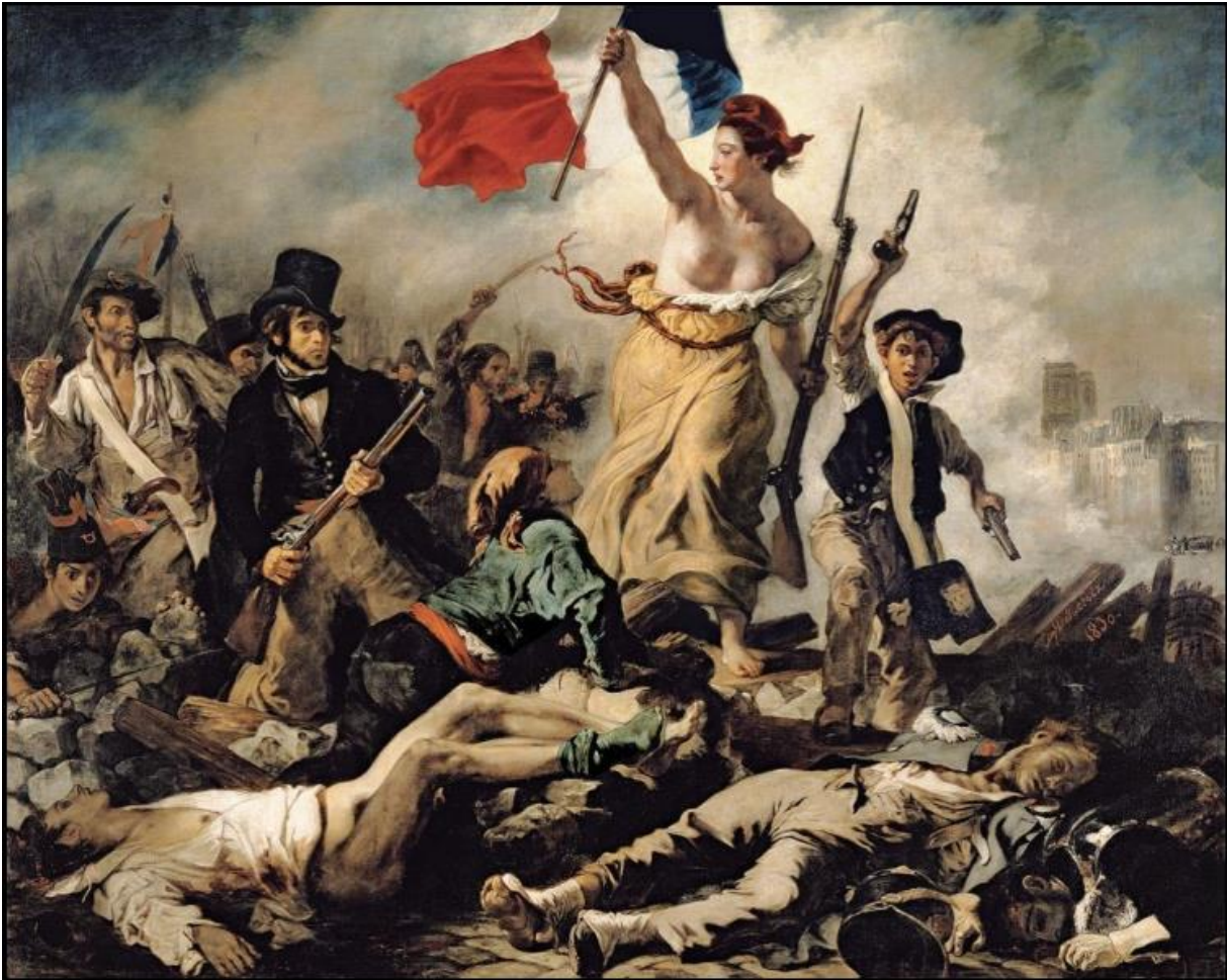
Eugène Delacroix, La Liberté guidant le peuple , 1830, huile sur toile, 260x325 cm, collection du Musée du Louvre.

La toile est en ligne sur le site de L'Histoire par l'image : https://histoire-image.org/fr/etudes/liberte-guidant-peuple-eugene-delacroix