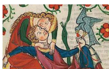
Les chansons des troubadours

L'université Montaigne de Bordeaux propose un MOOC sur Les Chansons de troubadours . Ce cours entend faire découvrir le monde des troubadours du Moyen Âge Occitan à travers leurs chansons et les idées qu'elles véhiculent. Nous verrons tout particulièrement comment ces poètes du XIIe siècle, en réinventant l'amour, ont révolutionné l'image de la dame, mais aussi comment, exédés parfois par la société de leur temps, ils chantent leur rage et leur désespoir. Ce cours donne lieu à une